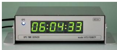
フロア固定アダプタ付